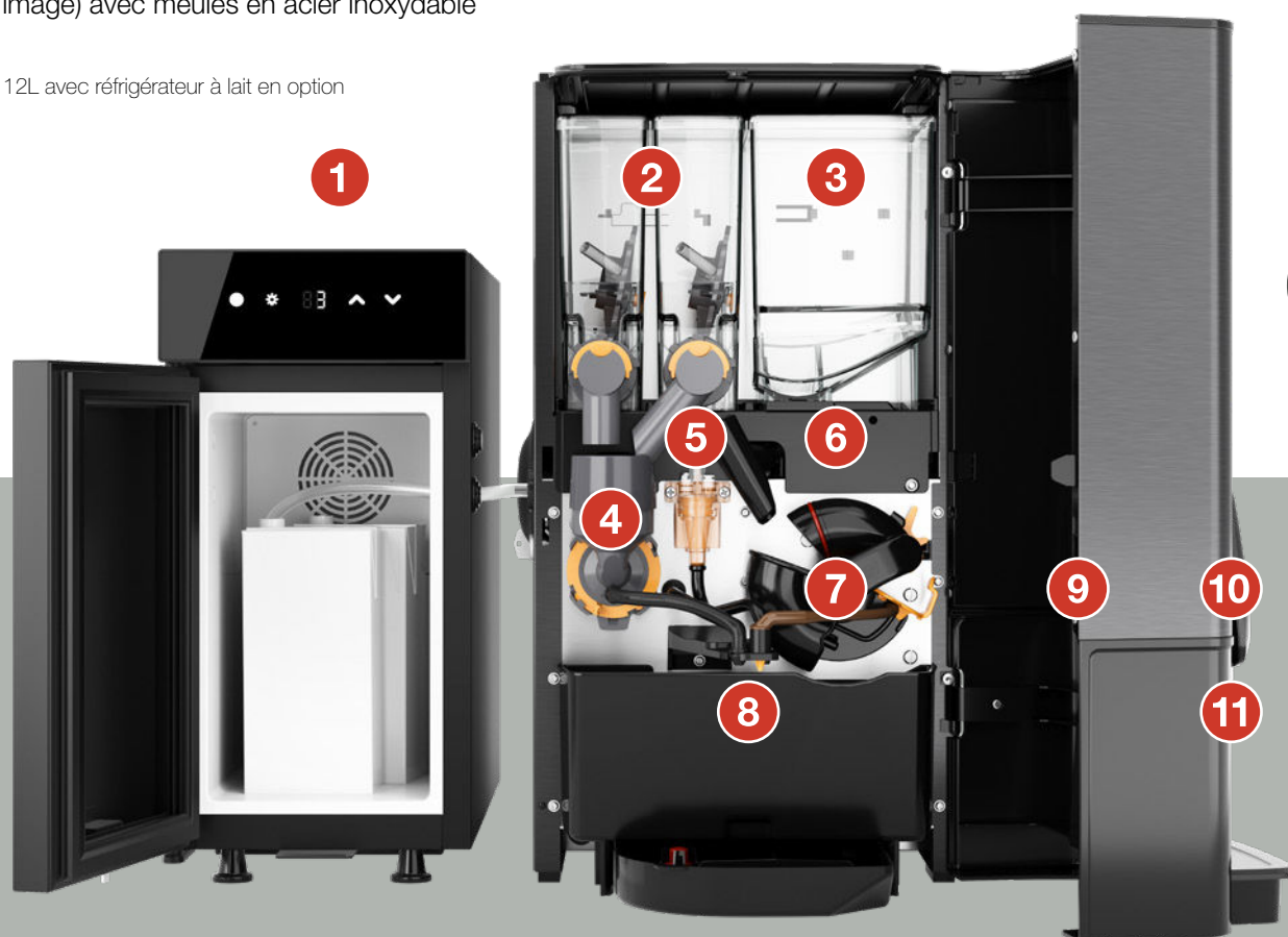
Sego 12L avec réfrigérateur à lait en option