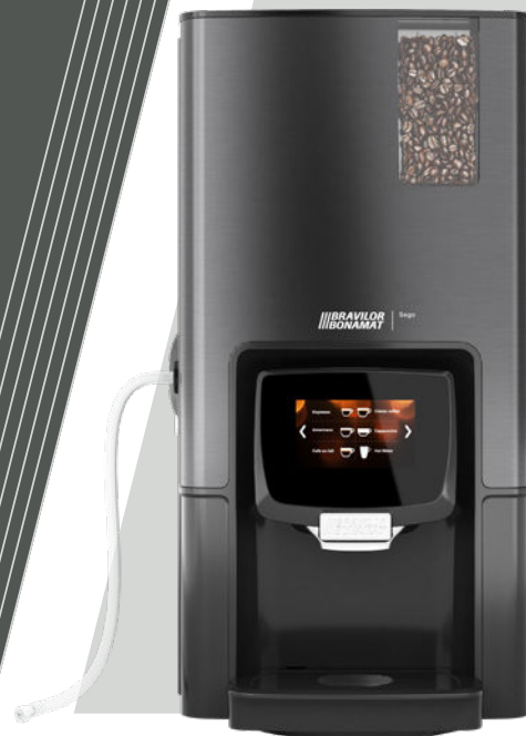
Sego L sans réfrigérateur