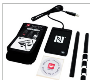
kit pour l'application Sego CCC