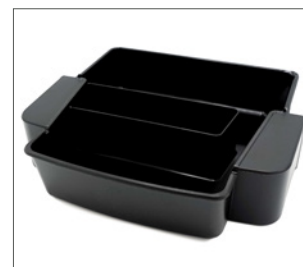
égouttoir de rehausse