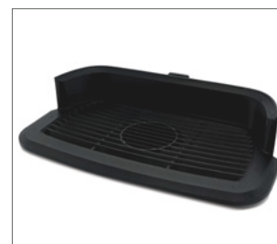
grille d'égouttoir abaissée