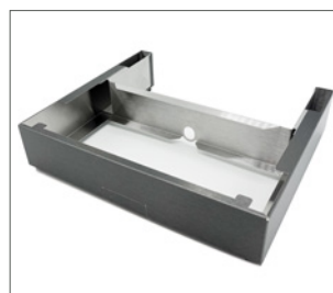
socle de rehausse

L'application Sego CCC (Contactless Coffee Control) est compatible sur la plupart des smartphones. Cette application en libre service sur internet permet à chacun d'utiliser son smartphone pour se servir un café, sans avoir à toucher l'écran de la machine.