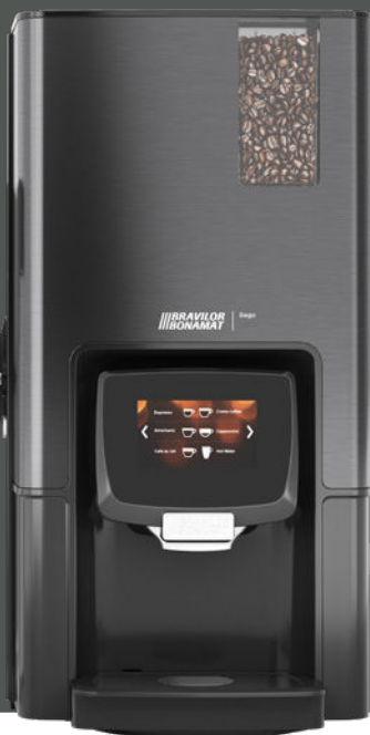
Sego L avec réfrigérateur