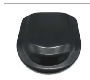
déflecteur de ventilateur