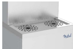
Grille inox pour poser les carafes Stainless steel grid for water jugs