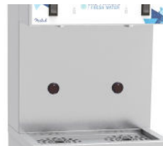
Option de distribution par capteurs infrarouge Distribution by infrared sensors in option