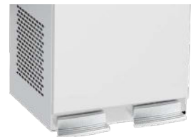
Option de distribution par pédales Pedal distribution option