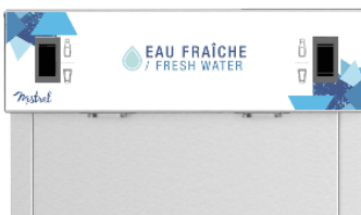
Buses de distribution interne pour éviter tout risque de bio-contamination Internal dispensing nozzles to avoid any risk of bio-contamination

Compatible avec le système anti-fuite Watersafe® (en option) Compatible with Watersafe® system (in option)