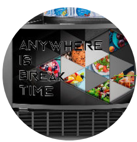
Un design simple pour une vraie cantine automatique