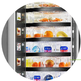
Flexibilité maximale de l'offre