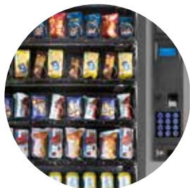
Un distributeur élégant et raffiné