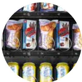
Vitrine haute visibilité