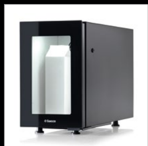
Mini frigo FR7L-N