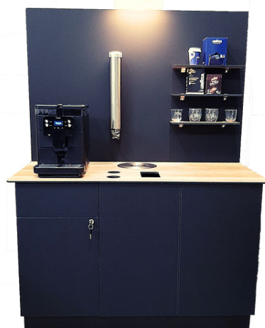
module 1 module 2 module 3 possibilité d'ajouter un 4ème module